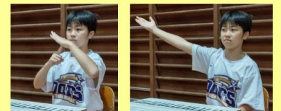
タイムアウトの合図