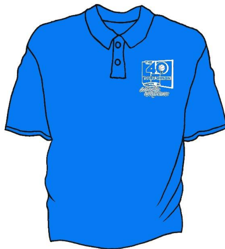
ミックスブルー（ホワイト）