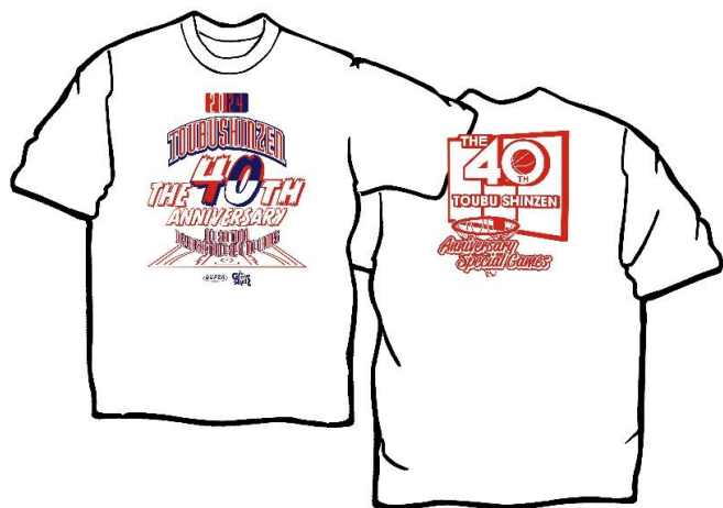
ホワイト（レッド・黒）