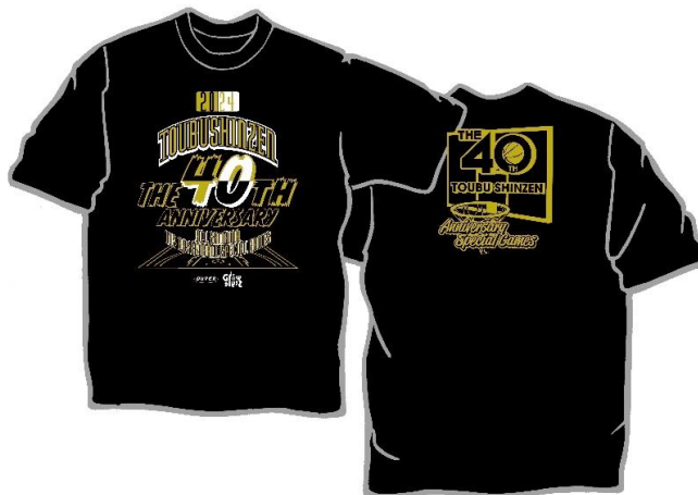
ブラック（ゴールド・ホワイト）