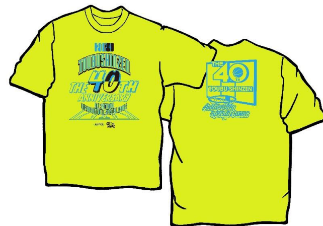
蛍光イエロー（ブラック）