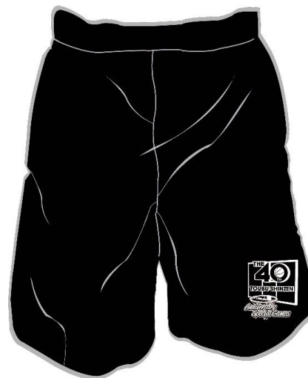
ブラック（ホワイト）