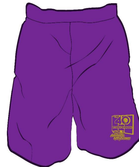
パープル（ゴールド）