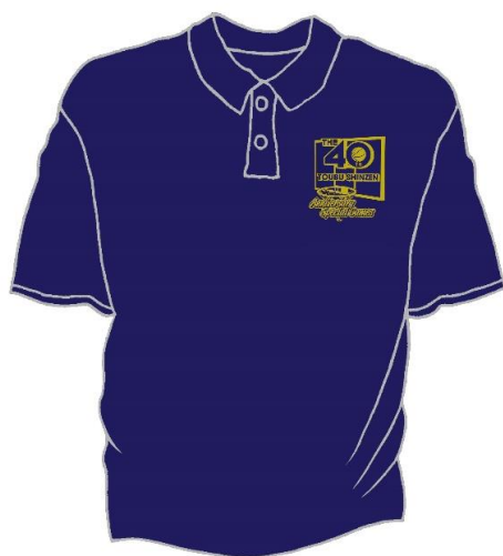
ネイビー（ゴールド）