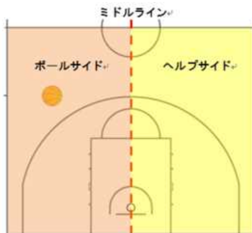
【図2】ミドルラインとボールサイド・ヘルプサイド